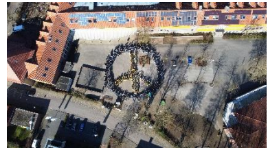
Peace-Zeichen in Havixbeck