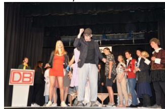
Aufführung des Literaturkurses Q 1