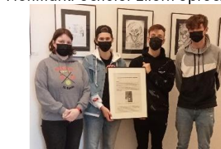
Ausstellung des Kunstkurses der Q1 im Stift Tilbeck