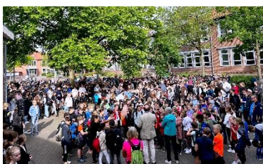
Eröffnung des Spielefests