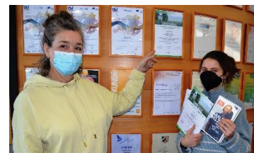
Erfolg bei der Biologie-Olympiade