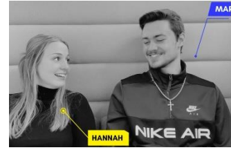
Podcast zur Landtagswahl NRW