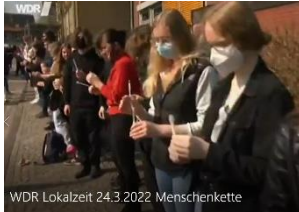
WDR Lokalzeit: Menschenkette an beiden Schulstandorten