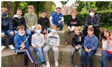
Erfolgreiche Teilnahme am Mathematikwettbewerb Bolyai