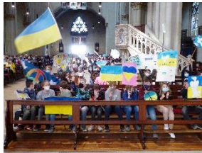
Gedenken im Billerbecker Dom