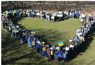
Schülerherz in Billerbeck