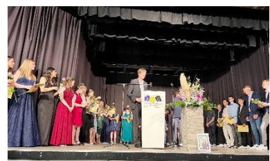
Abschlussfeier der 10er