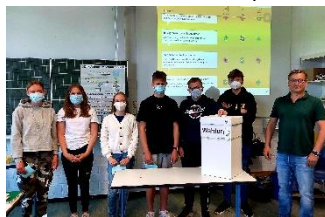
Juniorwahl zur Landtagswahl NRW, Billerbeck