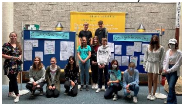
Lyrik gegen den Krieg