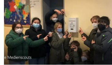
Kurzfilm der Medienscouts