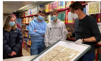
Geschichtskurs im Landesarchiv